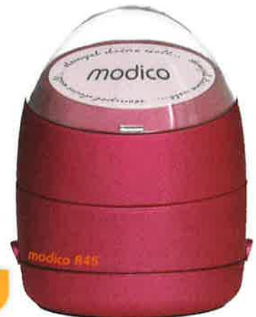
Symbolfoto - Gehäuse R45 - rot