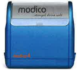
Symbolfoto - Gehäuse M4 - blau